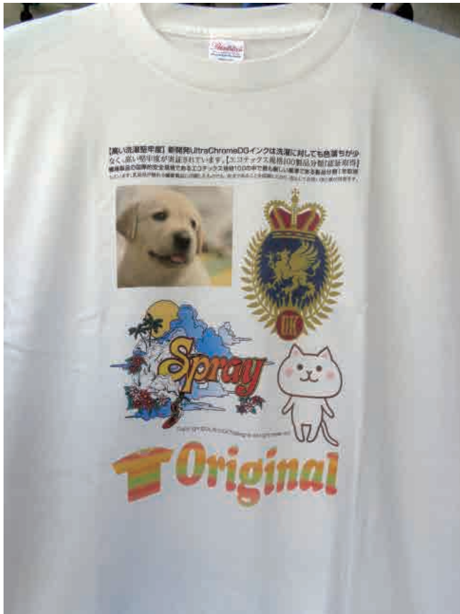
店頭サンプル 【Tシャツ白・前】